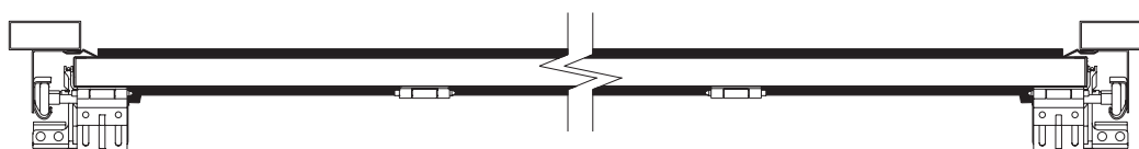
Fig. 3- Vista de la puerta en planta.